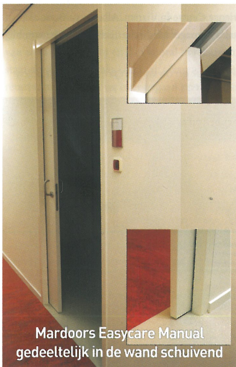
Mardoors Easycare Manual gedeeltelijk in de wand schuivend

In de marktbenadering wordt onderscheid gemaakt tussen de aandachtsgebieden cure, care en comfort. Dit onderscheid heeft enerzijds een direct verband met de verschillende schuifdeurconcepten die het bedrijf op de markt brengt en anderzijds met de adviserende rol die Mardoors in de voorfase van projecten vervult.