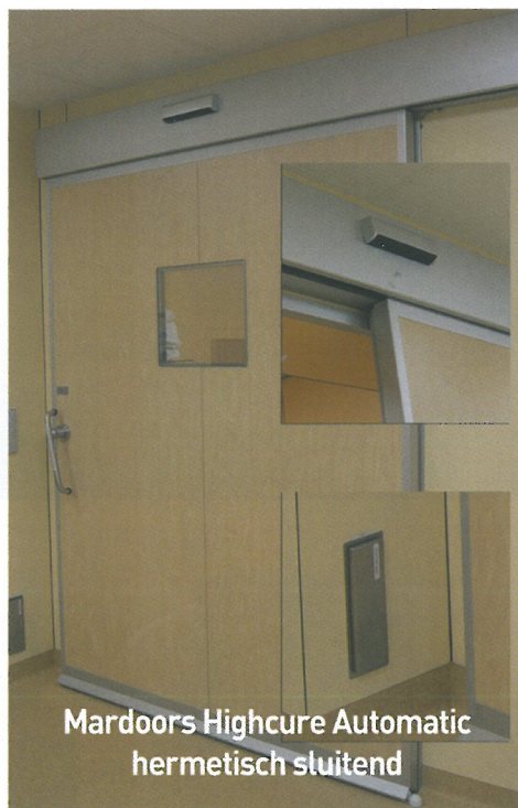
Mardoors Highcure Automatic hermetisch sluitend