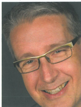
Door: Marc Verhelst

Mardoors schuifdeursystemen richt zich volledig op het adviseren, ontwikkelen, produceren, plaatsen en onderhouden van schuifdeursystemen in de zorgsector en zorg-gerelateerde organisaties en instellingen. Met name de toepassing van de in de zorg specifieke logistieke concepten, met die hierbij behorende ontsluiting van de ruimtes, drijft Mardoors tot een intensieve advisering in de voorfasen bij gezondheidsprojecten. Naast het informeren van opdrachtgevers, architecten en gebruikers over de toepassing van de schuifdeursystemen, maakt het bedrijf aangepaste plattegronden waar de voordelen van het gebruik van Mardoors schuifdeursystemen naar voren komen.